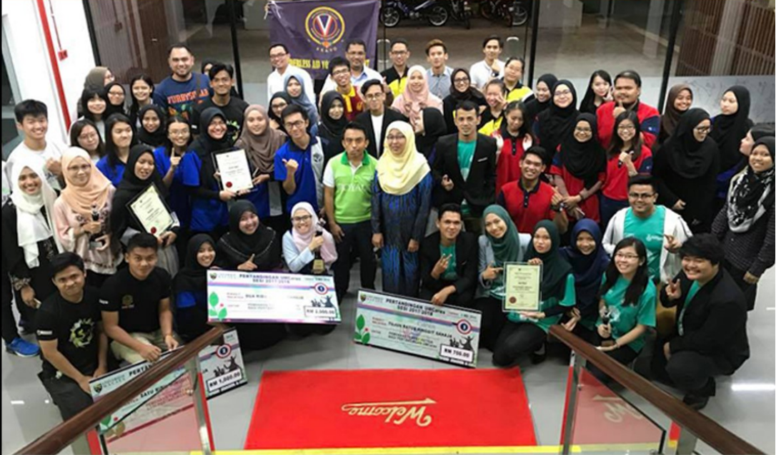
Majlis Penyampaian hadiah pertandingan UMCares Sesi 2017/2018